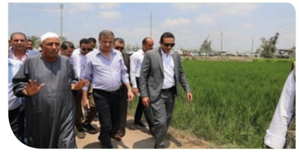
وزير الزراعة يتفقد حقول نظم الري الحديث بالطاقة الشمسية في دمنهور