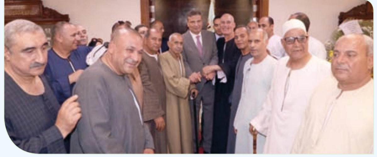
علاء فاروق يلتقي عددا من المزارعين

أكد علاء فاروق، وزير الزراعة واستصلاح الأراضي، أن الرئيس عبد الفتاح السيسي يولي القطاع الزراعي اهتماما خاصا، وهو ما انعكس بوضوح خلال السنوات العشر الماضية عبر رؤية متكاملة للتوسع الرأسى والأفقي في الزراعة، وزيادة المساحات المنزوعة، وتعظيم إنتاجية الأرض ووحدة المياه، إلى جانب الدعم الكبير لمركز البحوث الزراعية وقطاعات الوزارة المختلفة.