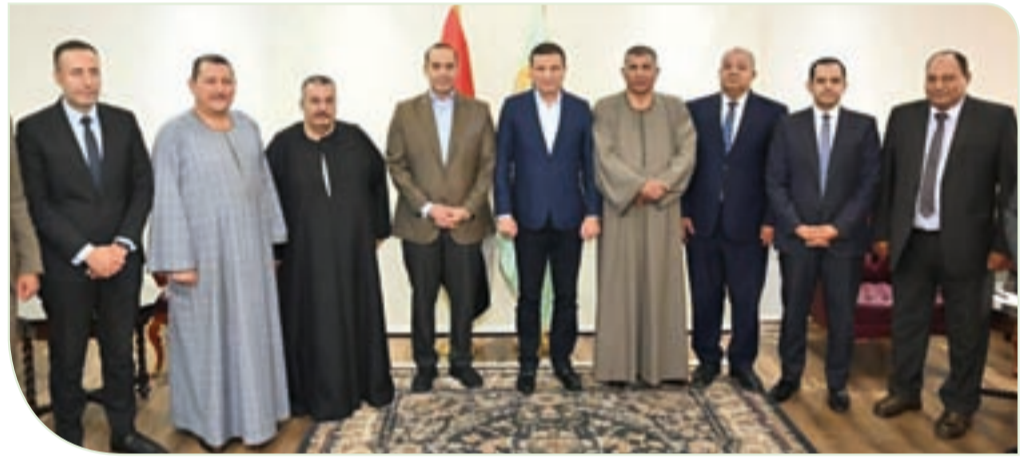
وزيرا الزراعة والشئون النيابية والقانونية يؤكدان على دور الجمعيات التعاونية في النهوض بالمنظومة الزراعية المصرية

كما شدد على أن مصر حققت الاكتفاء الذاتي من الدواجن وبيض المائدة والألبان، موضعا أن الدولة بالتعاون مع البنوك الوطنية نشرت مشروع «البتلو» الذي استفاد منه أكثر من 45 ألف مستفيد بإجمالي 522 ألف رأس، ويروض بلغت 10