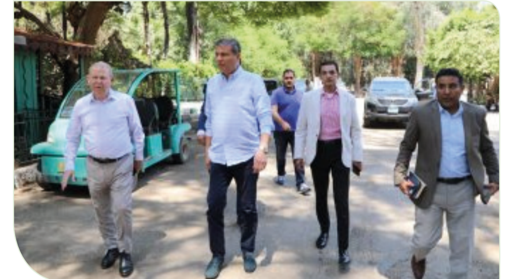
علاء فاروق وزير الزراعة يتفقد أعمال التطوير بـ حديقة الحيوان بالجيزة