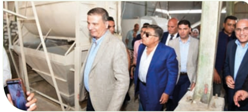
وزير الزراعة يتفقد مصنع أعلاف ومحطة إنتاج بيض بمركز دكرنس

وأشار إلى أنه تم توفير 5 ملايين جرة للتحصين ضد الحمى القلاعية، إضافة إلى الدفع بفرق الطب البيطري في جميع المحافظات، ما أسفر عن تحصيل أكثر من 8.1 مليون رأس من الثروة الحيوانية، لافتا إلى أنه رغم الجهود المكثفة، فقد ظهرت بعض الأعراض لدى مربيين لم يقوموا بتحصين عجولهم، مؤكدا أن أعداد هذه الحالات جاءت ضئيلة جدا مقارنة بما تم رصده في عام 2020.