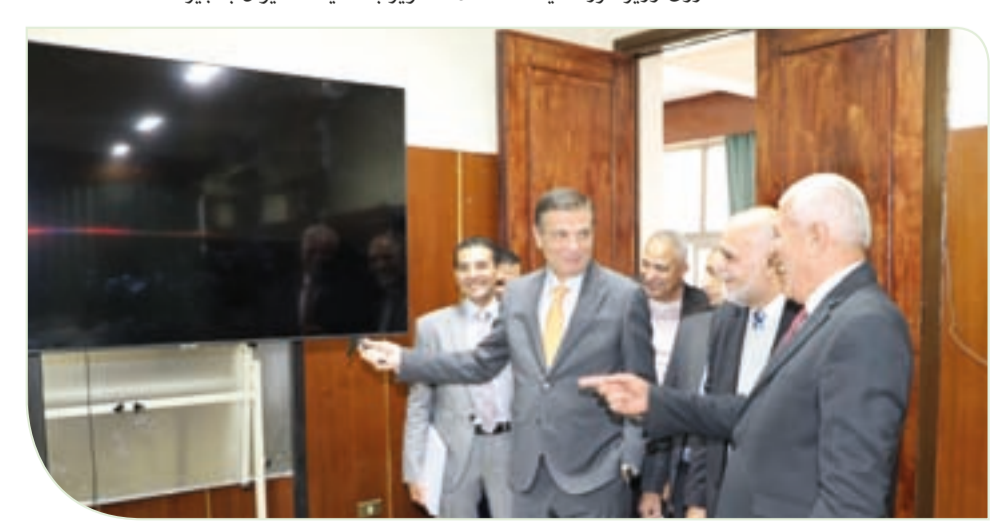
وزير الزراعة يتفقد نادي الزراعيين ويشيد بالخدمات المقدمة لاعضائه